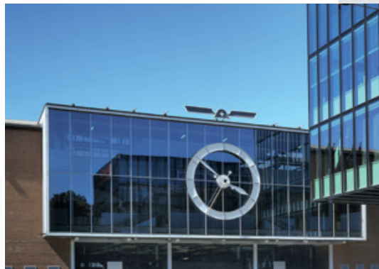
Wahrzeichen: die grosse Uhr