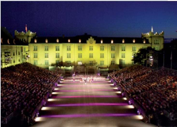
Winkler Multimedia Events AG

Die von uns selber erbrachten Leistungen erstrecken sich von der Beratung über die Planung bis zur Umsetzung, vom Eventmanagement über Bauten und Einrichtungen bis zur Veranstaltungstechnik. Und all dies mit einem hohen Mass an Flexibilität und Kundenorientierung. Denn eine partnerschaftliche Zusammenarbeit ist für uns genauso selbstverständlich wie die volle Zufriedenheit Ihrer Kunden.