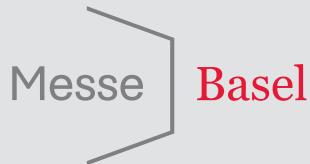
Messe Basel: Fakten und Zahlen