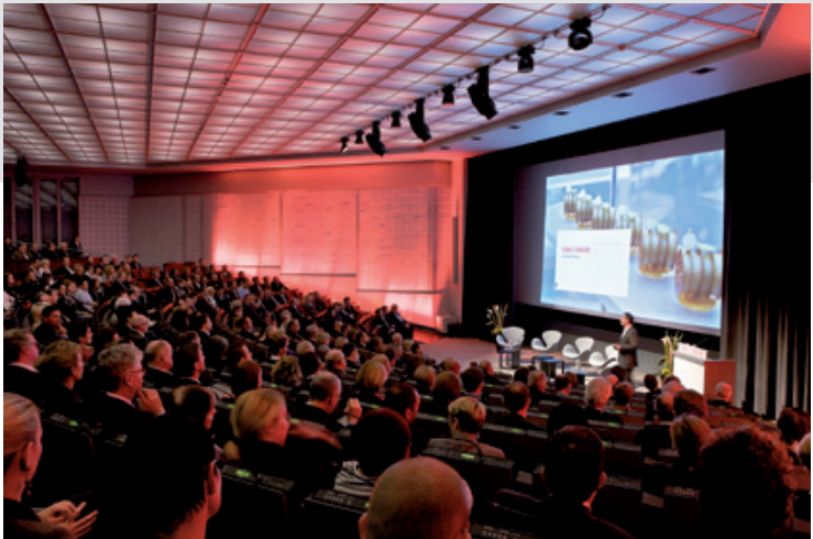
Vollständig renoviertes Auditorium Montreal