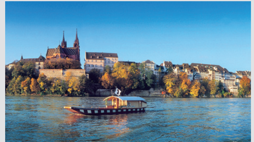
Rheinfähre vor Basler Altstadt

Basel liegt im Dreiländereck, wo sich die Schweiz, Frankreich und Deutschland treffen. Die Stadt am Rhein ist eine wichtige Drehscheibe des internationalen Verkehrs: Der stadtnahe Flughafen, der Rheinhafen, zwei zentrale Bahnhöfe, der gut ausgebaute öffentliche Verkehr sowie das moderne Strassennetz sichern die Verbindungen in die ganze Welt.