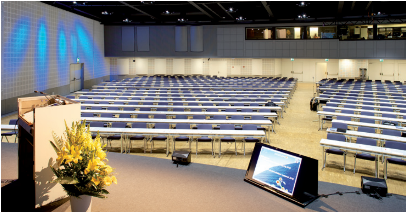
Grösster Plenarsaal San Francisco