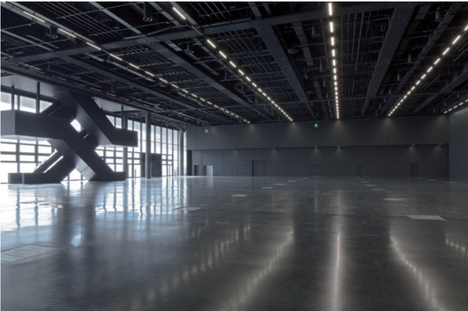
Event Halle mit oder ohne Tageslicht