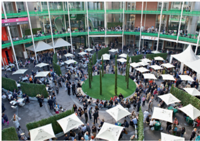
Rundhof Halle 2

Die Halle 2 trägt das Wahrzeichen der Messe Basel, die grosse Uhr, an der Glasfront über dem Haupteingang. Blickfang im Inneren ist der architektonisch einzigartige offene Rundhof mit seinen Galerien. Er bildet den perfekten Rahmen für jede Art von Veranstaltung mit begleitenden Open-Air-Aktivitäten. Dank dem offenen Innenhof verfügen alle drei Stockwerke der Halle 2 über viel Tageslicht und vermitteln ein angenehmes Raumgefühl.