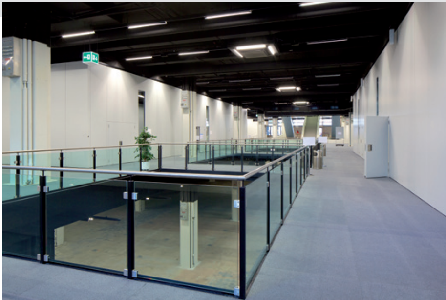
Modulare Räume in der Halle 4.0

Die dreigeschossige Halle 4 zeichnet sich durch die unmittelbare Anbindung an das darüber liegende Congress Center Basel aus. Sie bietet damit die ideale Kombination von Messe-, Konferenz- und Ausstellungsinfrastruktur. Im Erdgeschoss der Halle 4 können elf modulare Räume gebaut werden, die direkt vom Haupteingang des Congress Center Basel zugänglich sind. Neben eigenständiger und unabhängiger Nutzung eignet sich die Halle 4 insbesondere für Messen mit parallelen Fachveranstaltungen sowie für Kongresse mit Break-out Session und Begleitausstellungen. Die Halle 4 ist über eine Passarelle direkt mit dem Neubau der Halle 1 verbunden. Auf der Ebene der Halle 4.1 befindet sich weiter ein direkter Zugang zum 5-Sterne-Hotel Swissôtel Le Plaza Basel.