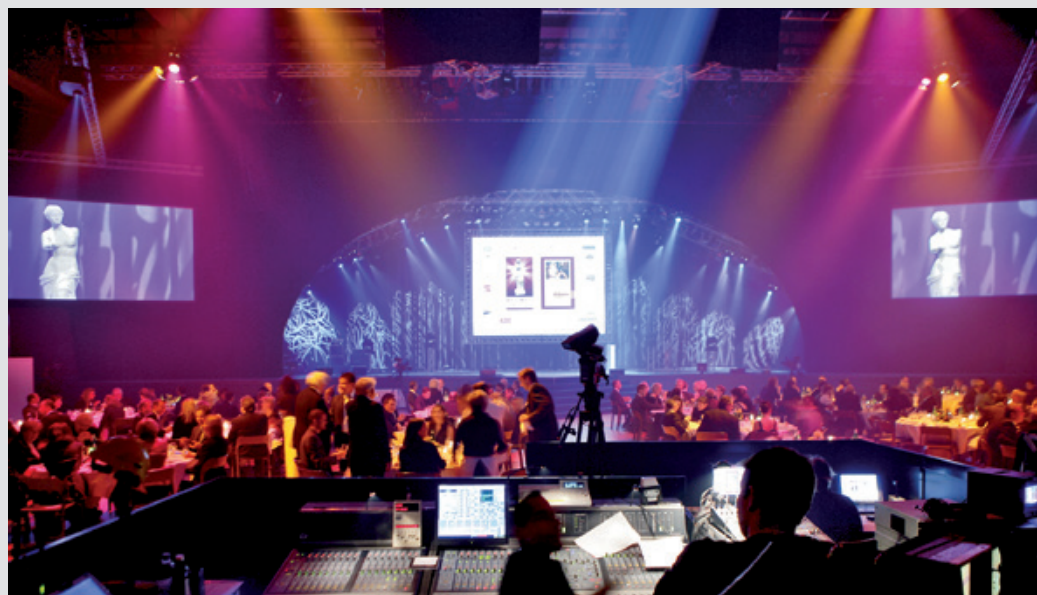
Wellness Aphrodite Event