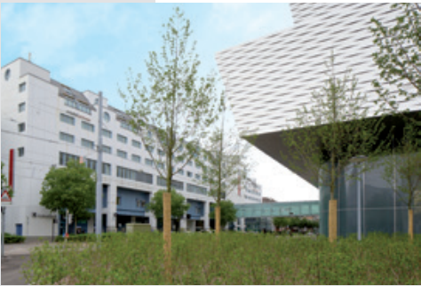
Aussenansicht Congress Center Basel