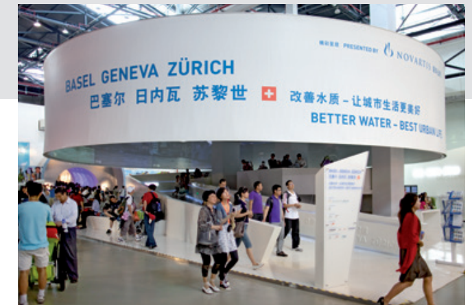
Expomobilia AG – Standbau

Ihrem Bedürfnis entsprechend nehmen wir gerne die Verantwortung für das Gesamtprojekt, verschiedene Teilprojekte oder einzelne Prozessschritte wahr.