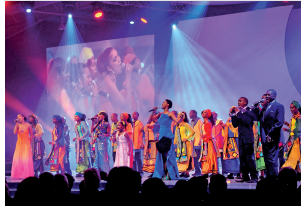
Rufener events Ltd. – Eventmanagement