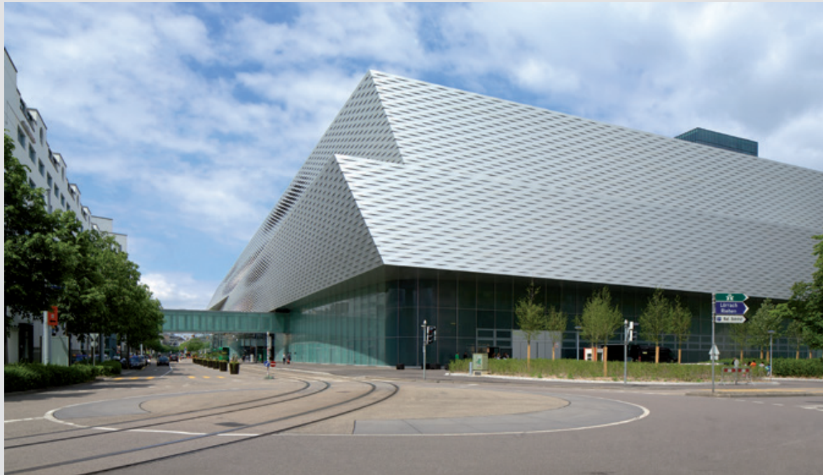
Neue Halle 1

Der vom Basler Architekturbüro Herzog & de Meuron entworfene Messe-Neubau verbindet in geradezu perfekter Weise Funktionalität und Ästhetik. Die gesteigerte Kompaktheit des Geländes erlaubt eine wesentlich flexiblere Bewirtschaftung und erhöht den Komfort für die Besucher. Gleichzeitig ist der Neubau eine beeindruckende architektonische Visitenkarte